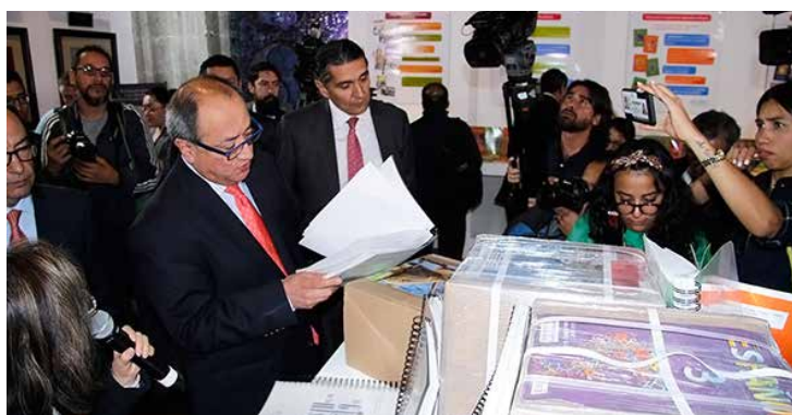
Otto Granados Roldán presenta a los medios los libros de texto gratuitos.

A su vez, la directora general de Materiales Educativos de la SEP, Aurora Saavedra Solá, explicó el proceso de elaboración de los libros de texto y materiales educativos, y destacó el apoyo de maestros y de organizaciones civiles, para tener textos de alta calidad, e indicó que más de 400 personas participaron en este esfuerzo, entre especialistas, diseñadores, autores, formadores y revisores, entre otros.