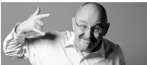
Benito Taibo.

En sus inicios como reportero, Benito Taibo escribió una historia sobre tráfico de aves silvestres que 25 años después era usada en la Facultad de Filosofía y Letras de la UNAM, en la carrera de periodismo, como ejemplo para la formación en el oficio. Hoy día, es conocido como poeta, como novelista, como director de Radio UNAM, como incansable promotor de la lectura y como una voz activa y respetada en las redes sociales. Volver a la FIL