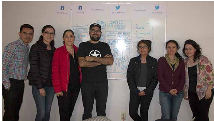
Participantes del curso.

El Dr. Black cursó la licenciatura en Diseño Gráfico en la Escuela Nacional de Artes Plásticas de la Universidad Nacional Autónoma de México (UNAM), además de diversas especializaciones en infografía y visualización de la información en Boston. Tiene más de 15 años de experiencia en la construcción, diseño, planeación y visualización de la información. Actualmente se desempeña como Editor General de Infografía y Arte de Grupo Milenio. Desde 2006 es Director de Arte del estudio de infografía, visualización de datos, diseño e ilustración Creative Studio Inc. Su trabajo incluye diversas publicaciones en diarios de México, Estados Unidos, Europa y Sudamérica. Así como el área de visualización de datos, animación e infografía de ESPN/ Disney.