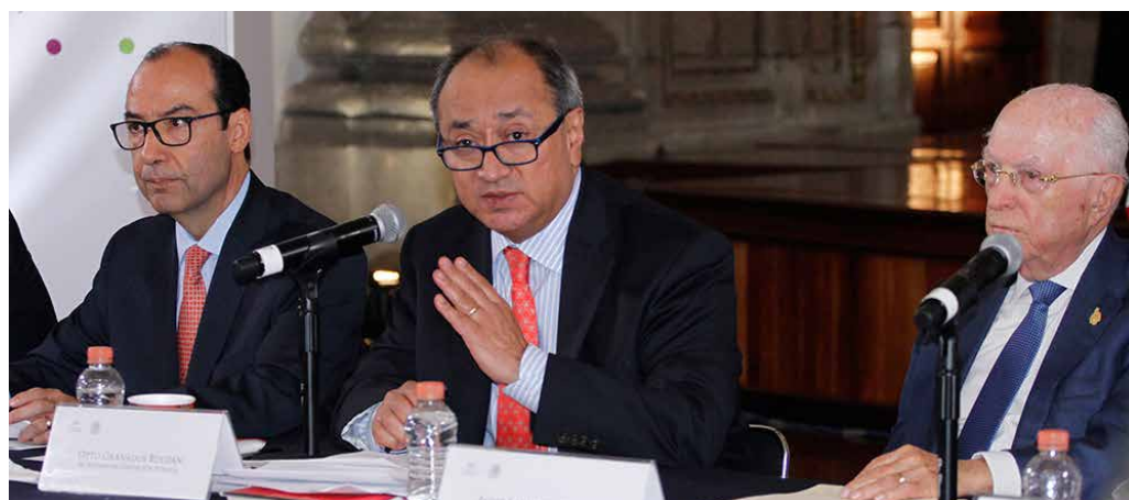
Javier Treviño Cantú, Otto Granados Roldán y Jaime Labastida Ochoa.

Señaló que esta nueva generación de libros está acorde con los lineamientos de la Reforma Educativa, la que considera la necesidad de tener mejores escuelas y maestros, nuevos planes de estudio, así como libros renovados y de alta calidad, y en cuya preparación