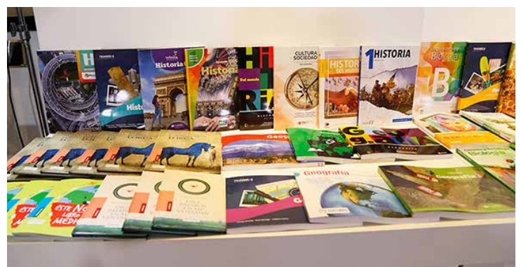
Muestra de los nuevos libros de texto gratuitos.